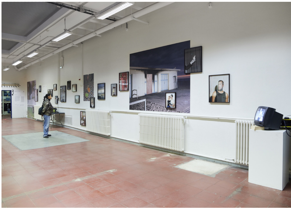
Jacopo Benassi / Henri Kisieleski / Max Pam - Planches Contact © Laura Martin