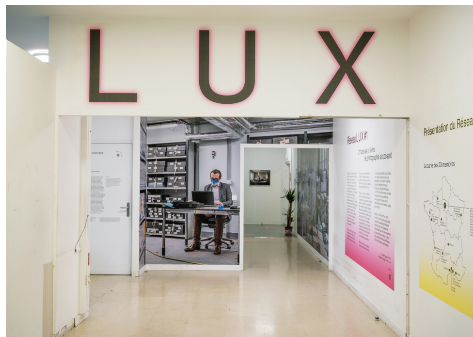
Olivier Culmann - Planches Contact