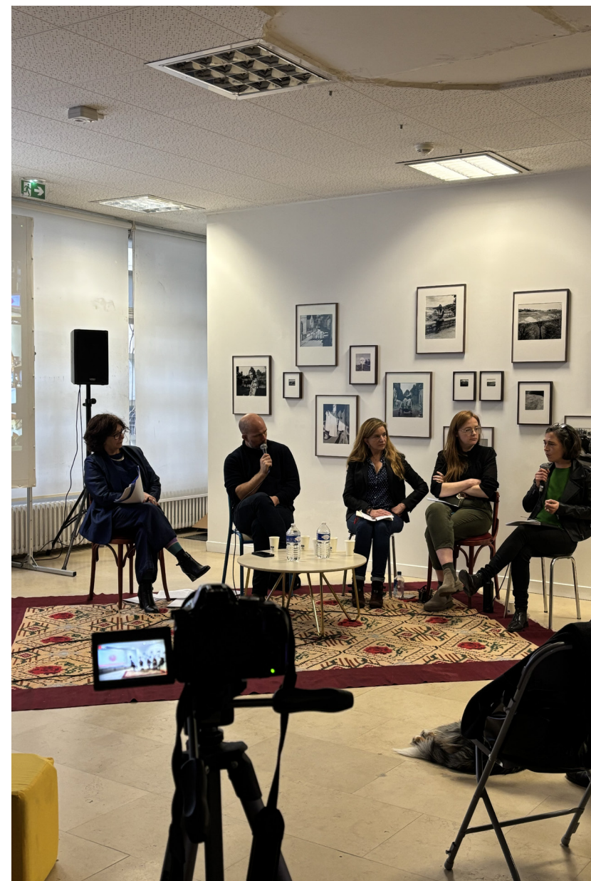
Table Ronde Réseau L U X