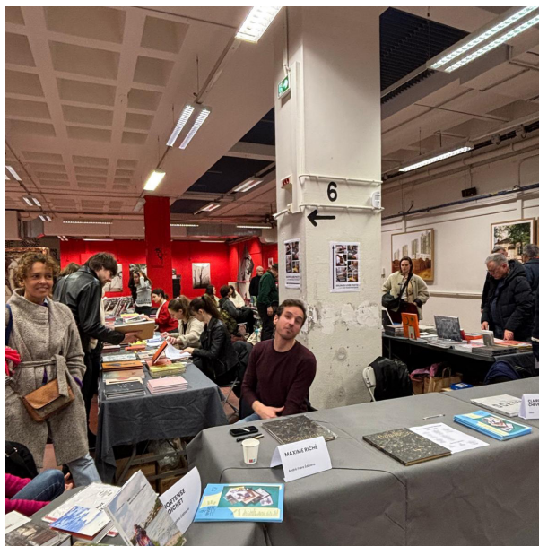
de gauche à droite de haut en bas : talk Institut Ukrainien, lectures de portfolio Réseau L U X, studio Photo Care, salon du livre France Photobook , visite scolaire