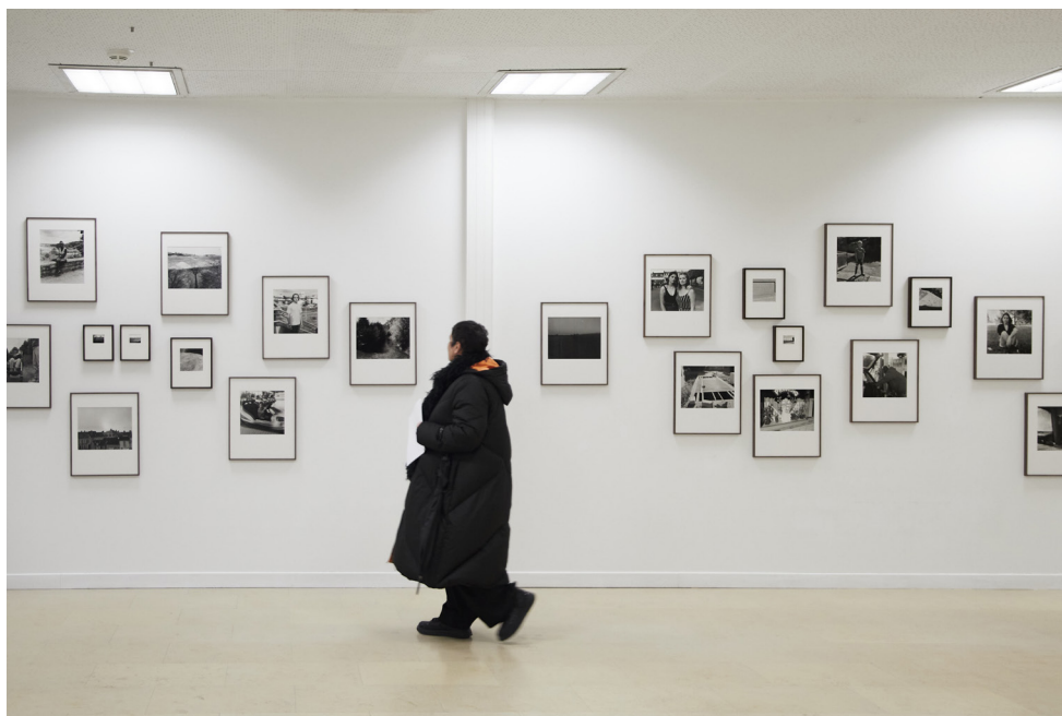
Pascal Amoyel - PhotoSaintGermain