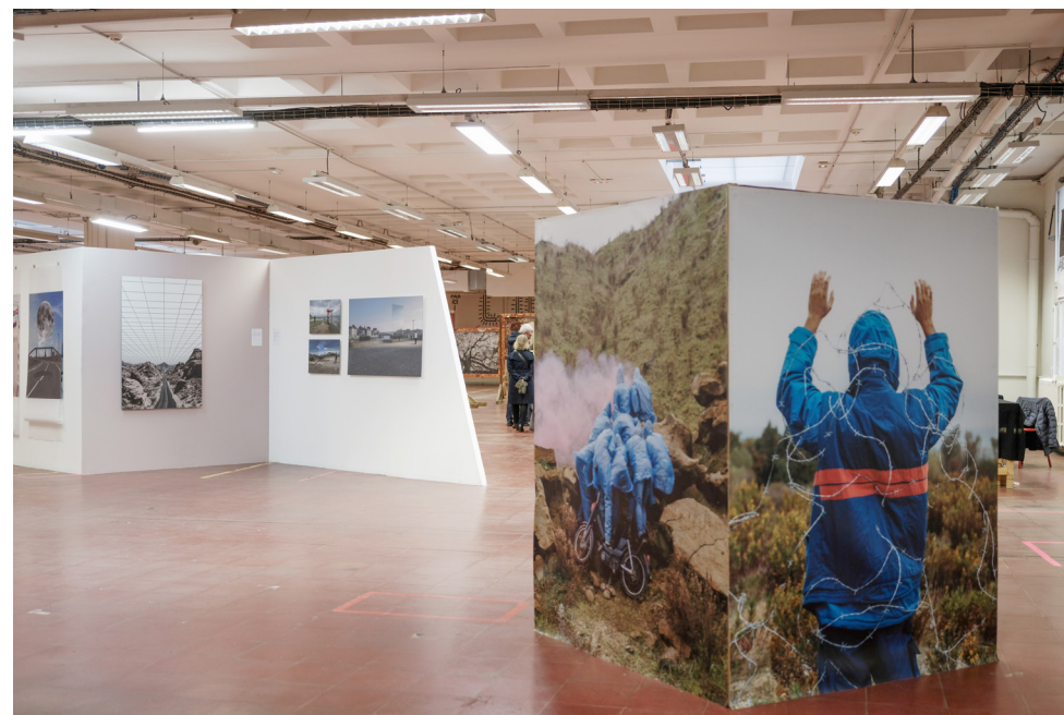
Olgaç Bonzalp - Mesonographie • installation collective - Biennale de l'Image Tangible • Vik Muniz - PhotoClimat